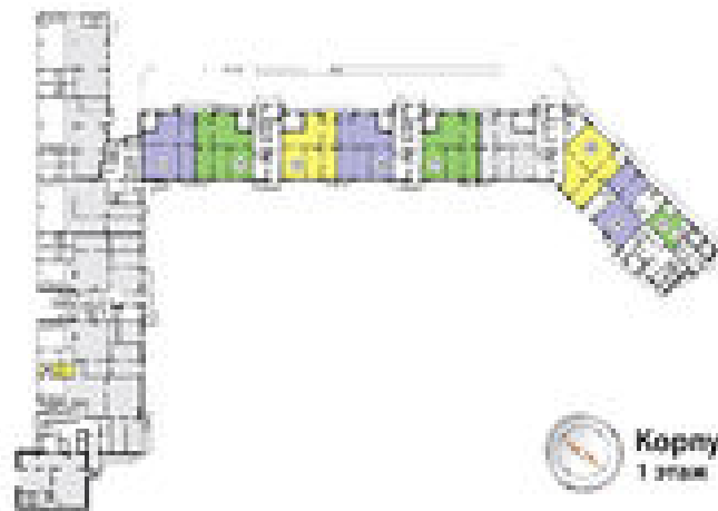
Комплекс №21 1 этаж